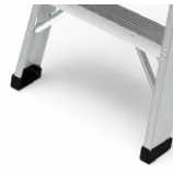
Zapatas en caucho antideslizante.