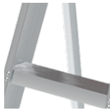
Escalones en aluminio corrugado con antideslizante