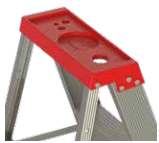
Bandeja porta herramientas

Esta escalera es extremadamente ligera, resistente y segura. Viene equipada con zapatas antideslizantes que garantizan un trabajo estable en diversos tipos de terreno, y también cuenta con dispositivos de bloqueo que evitan que se abra accidentalmente.