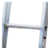
Peldaños tipo D en aluminio corrugado ergonómico

(Medidas en centímetros. Tolerancias en las medidas de \pm 1.5\text{cm} )