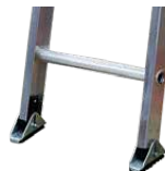
Zapatas en caucho antideslizante.